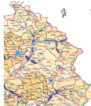
ОБЗОРНА КАРТА НА РАЙОНИ С ПОТЕНЦИАЛЕН РИСК ОТ НАВОДНЕНИЯ В ЗАПАДНОБЕЛОМОРСКИ РАЙОН М 1:200 000

С документа се цели създаване на модел за трансгранично сътрудничество между двете общини, като при успешната му реализация ще се постигне подобряване на състоянието на компонентите на околната среда, в частност водите, в т.ч. ще се минимизират негативните последици от възникването на наводненията. Моделът може да бъде използван като добра практика в други трансгранични райони.